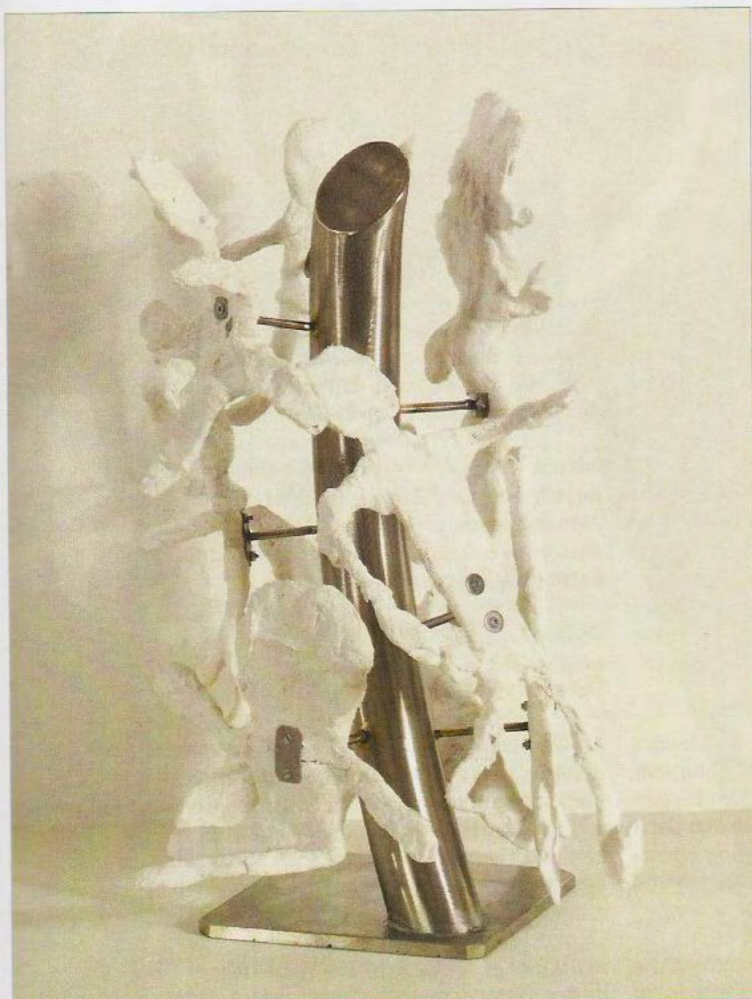
Skulptur „Let's move“ – Draht, Gips, Niro, 20x60cm